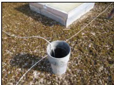
Photo N° 597 AMIANTE CIMENT -- Toiture terrasse Conduits de fluide Ventilation haute (Fibres-ciment)

Dossier n°: 2013-09-300 FK DTA PC_077LAI _OPH